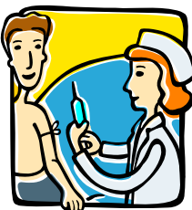
Técnico CUIDADOS AUXILIARES DE ENFERMERÍA