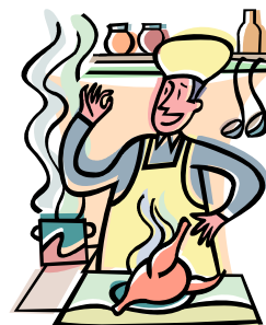
Técnico en COCINA Y GASTRONOMÍA