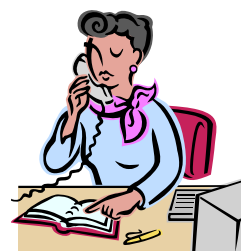
Técnico en GESTIÓN ADMINISTRATIVA

* REQUISITOS DE ACCESO (Alguno de los siguientes):